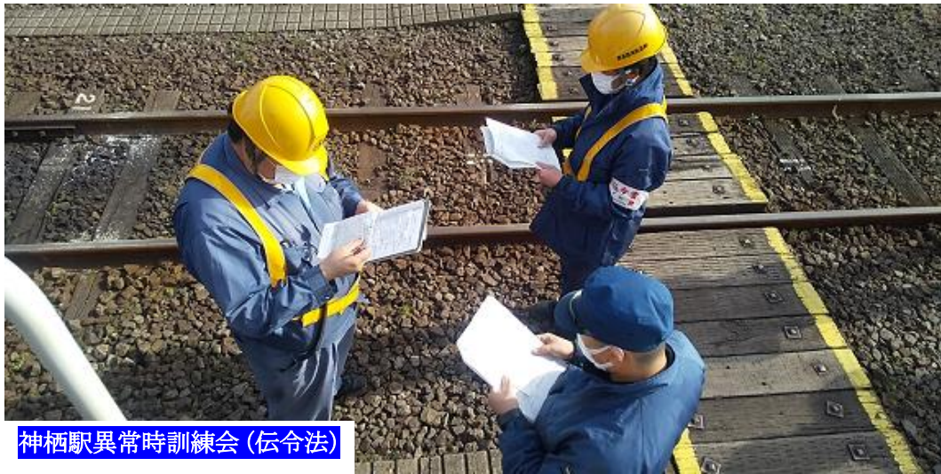
神栖駅異常時訓練会 (伝令法)